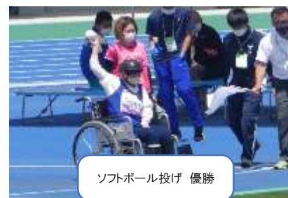
ソフトボール投げ 優勝