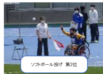
ソフトボール投げ 第2位