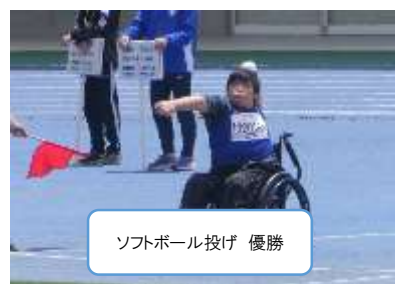
ソフトボール投げ 優勝